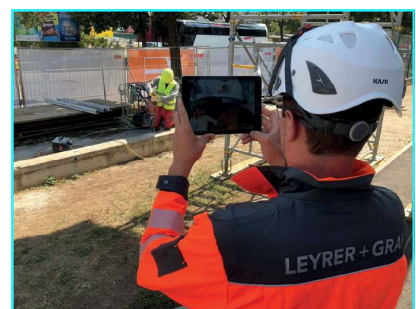
Kommunikation – eines der größten Dramen am Bau