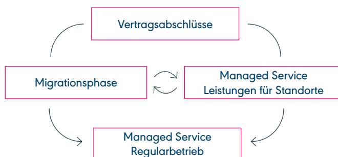
Phasen im Managed Service SD-WAN

Wenn bei Ihnen größere Projekte im Bereich SD-WAN oder ein Migrationsprojekt (z.B. Umstellung aller Standorte auf einen neuen Provider) anfallen, bieten wir Ihnen als Unterstützung optional eine professionelle Projektabwicklung. Ein Team von Projektmanagement-Profis kümmert sich um alle Belange in Bezug auf die optimale Umsetzung Ihrer vor- und nachgelagerten Projekte: Ganzheitlich dokumentiert, standardisiert nach PRINCE2 und angepasst an Ihre Bedürfnisse und Wünsche.